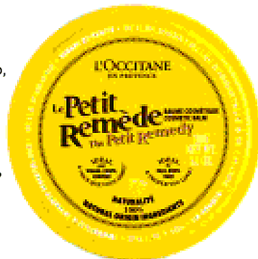
STILE RETRÒ Balsamo che ammorbidisce e nutre, arricchito con burro di karité, lavanda e arnica: Le petit remède de L'Occitane (€ 12).