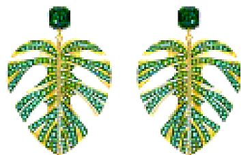
SCINTILLANTI A forma di foglia gli orecchini Swarovski, € 169. swarovski.com