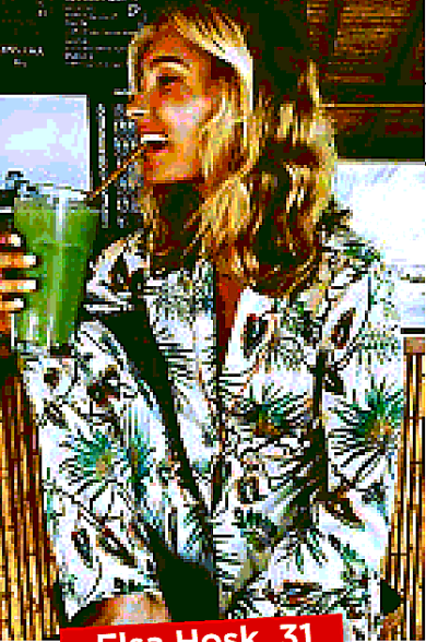
Elsa Hosk, 31 Stile pigiama

La modella svedese, ex angelo di Victoria's Secret, sceglie un morbido completo con un motivo vegetale effetto tundra.