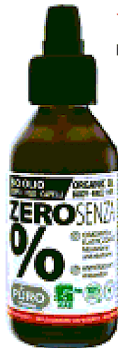
ADATTO AI VEGANI Molto delicato, con olio di mandorle: Olio Corpo-Viso-Capelli di Puro Bio Zero Senza % (€ 7,95).