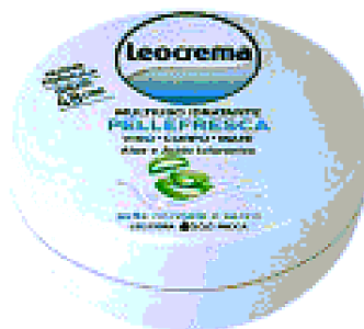
ALOE DISSETANTE Arricchita con aloe e acido ialuronico Crema Multiuso Pellefresca di Leocrema (€ 1,79).

OTTIMI PER LA BELLA STAGIONE, I RIMEDI MULTIUSO LENISCONO E IDRATANO VISO, CORPO E CAPELLI IN UN BALENO