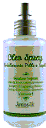
SE VAI DI FRETTA Olio generoso, si assorbe in pochi minuti: Oleo Spray Rivitalizzante pelle e capelli di Antos (€ 19).

La top model al sole vaporizza sul viso una lozione lenitiva.